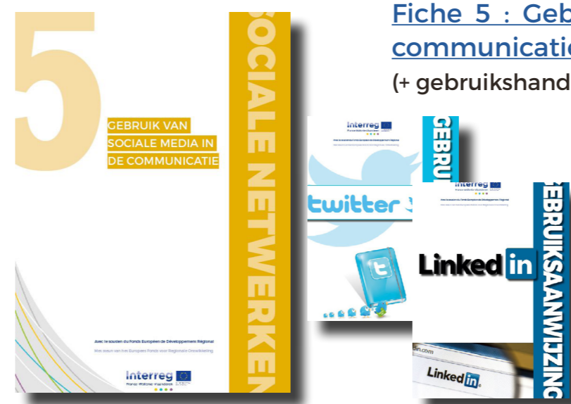
Fiche 5 : Gebruik van sociale media in de communicatie (+ gebruikshandleiding Twitter en LinkedIn)